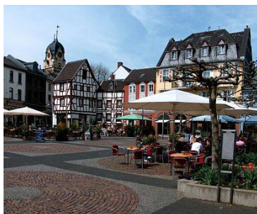
Alter Markt, Euskirchen

Die Kreisstadt Euskirchen liegt landschaftlich reizvoll im Städtedreieck Aachen (70 km) - Bonn (30 km) - Köln (40 km). Dies ist ein Grund, warum sich Euskirchen, mit über 58.000 Einwohnern, zu einem attraktiven und dynamischen Mittelzentrum mit oberzentralen Funktionen entwickelt hat. Garant für die positive Entwicklung sind leistungsstarke Handwerks-, Handels-, Gewerbe- und Industriebetriebe, die sich in Euskirchen als größter Stadt des gleichnamigen Kreises niedergelassen haben.