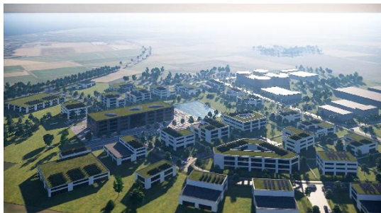
BPJ-Flug in die Zukunft